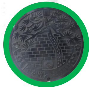
農業集落排水マンホール