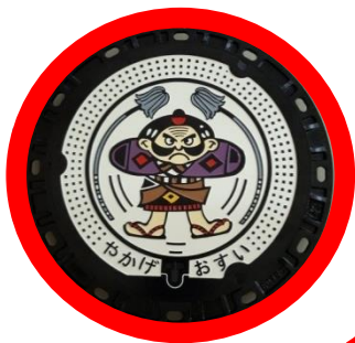
マンホールカードマンホール (北緯34°37'24.9"東経133°35'20.9")

矢掛町では旧農業集落排水は町の「木」「花」「街並み」をイメージしたデザイン蓋、公共下水道は町の最大イベントである「大名行列」で活躍する「やっこ」をイメージしたデザイン蓋を使用しています。マンホールカードの着色は町内の小学生から公募しました。