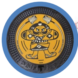
公共下水道マンホール